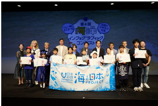
参加者全員による記念撮影